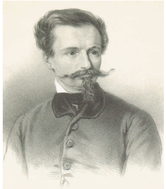
Wincenty Pol, 1855 r.