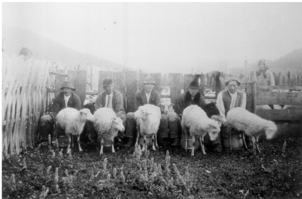
Ryc. 3. Dojenie owiec na Majerzu, ok. 1930 r. Repr. M. Wesółowska. Sheep milking in Majerz, ca. 1930, Reproduction by M. Wesółowska.