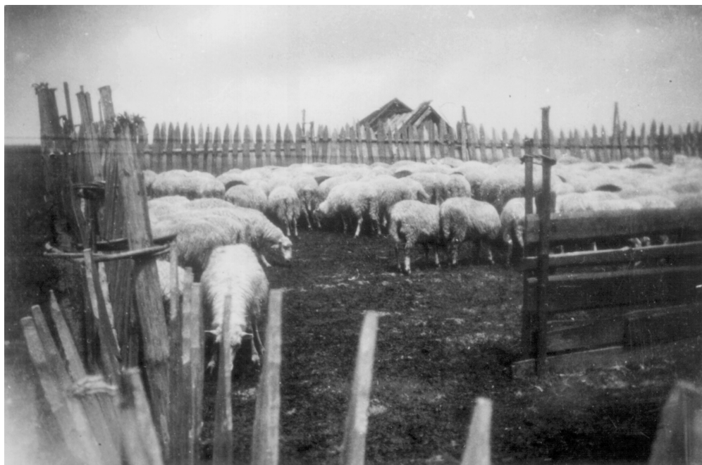
Ryc. 2. Owczarnia dworska na Majerzu, ok. 1930 r. Manorial sheep farm in Majerz, ca. 1930,